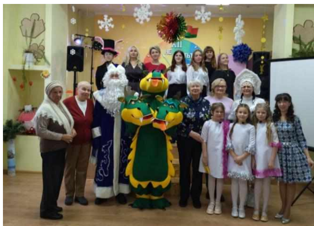
Фото 9. Концертно-поздравительная программа для пожилых людей и ветеранов педагогического труда «От всей души»

В рамках республиканского конкурса молодёжных социальных проектов «Молодёжь Беларуси за жизнь, нравственность и семейные ценности» в номинации «Молодёжь за ТВОРЧЕСКИЙ ПРОРЫВ ради жизни!» в 2023 году