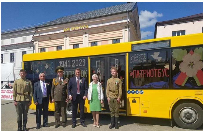
Фото 6. Инициатива «ПатриотБус», 2023г.

Совета депутатов Новогрудского райисполкома. Это проекты: «Молодёжная блогер-студия «Мейнстрим», интерактивная игра «Цели устойчивого развития – познаём вместе!», районный патриотический проект «Сёстры Хатыни.