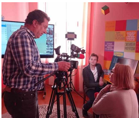
Фото 8. Интервью телеканалу БТ4

Участие в работе молодёжной блогер-студии даёт возможность учащимся критически проанализировать и объективно оценить реальные ситуации общения, в том числе в онлайн пространстве, повысить информационную грамотность, понимание ответственности за своё поведение в информационном