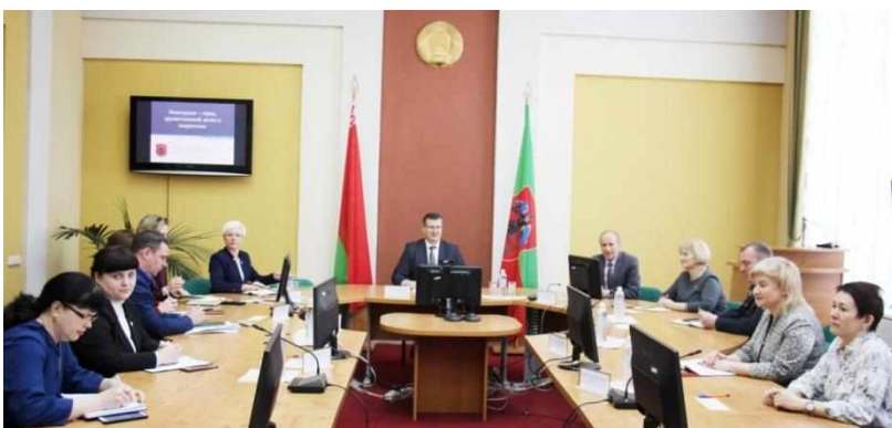
Фото 1. Диалоговая площадка «Новогрудок – город, дружественный детям и подросткам», 2023г.

В работе молодёжного парламента с целью решения задач государственной молодёжной политики используется практика проведения совместных заседаний с органами местного управления (фото 1).