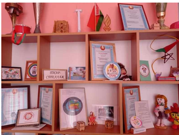
Фото 3. Оформление пиар-стеллажа в районной комнате для работы с детьми и молодёжью

Наглядным примером воплощения инициатив парламентариев, при поддержке руководства города, управления образования Новогрудского райисполкома является социальный проект, социальный