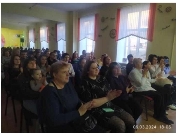
Фото 10, 11. Концертно-досуговая программа «Семья - планета счастья»

В рамках проекта в 2024 году проведены концертно-поздравительная программа для пожилых людей и ветеранов педагогического труда «От всей души» (фото 9), фотовыставка «Увлечение моих родителей», выставка детского рисунка «Главнее всех - моя семья», встреча с родителями, посвященная развитию одаренности детей в сфере музыкального инструментального творчества, развитию мотивационной сферы с демонстрацией учебных достижений учащихся, концертно-досуговая программа «Семья – планета счастья», выставка семейного творчества и увлечений «Творчество объединяет и вдохновляет», рисунка «Главнее всех - моя семья» (фото 10,11). Проект способствует формированию устойчивого интереса к совместной родительско-детской творческой деятельности, тем самым укрепляя институт семьи.