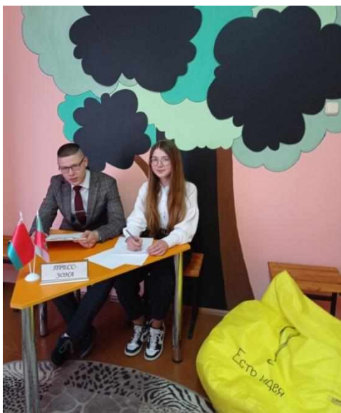
Фото 4. Оформление пресс-зоны

детей и молодёжи «ДАР» и депутатов молодёжного парламента. В комнате, созданной в едином художественном стиле, продуманы несколько функциональных зон. Имиджевая зона оформлена в виде выставочной экспозиции, которая знакомит с историей развития детских и молодежных объединений, в пиар-зоне собраны символы и рекламные продукты пионерских дружин (фото 3), пресс-зона оборудована мебелью для работы членов районной