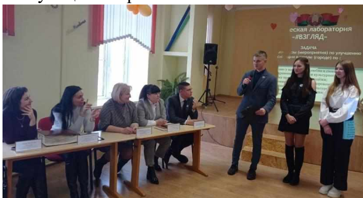
Фото 2. Открытый диалог «Взгляд» в рамках Сессии молодёжного парламента, 2023г.

молодёжного парламента взрослые и дети в деловой атмосфере обсуждают волнующие вопросы.