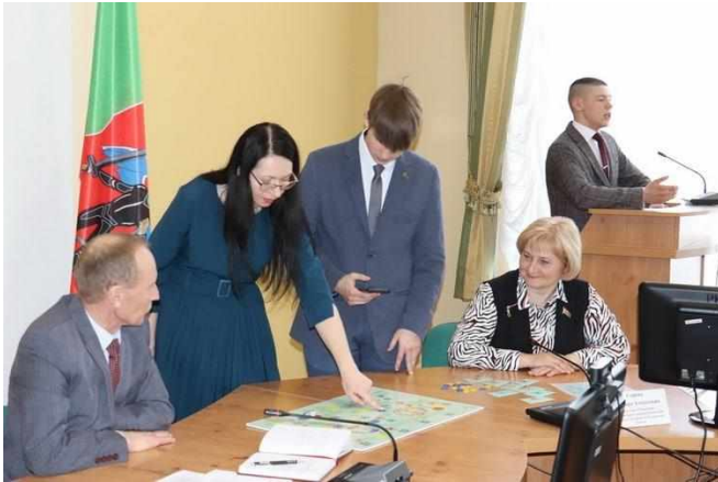
Фото 5. Встреча с председателем Новогрудского районного Совета депутатов

На протяжении 2022-2023 г.г. при поддержке руководства города, общественных организаций успешно реализованы социальные проекты, разработанные юными парламентариями во время районного марафона социальных инициатив «Всё начинается с идеи» и презентованные на встрече с руководством города и председателем